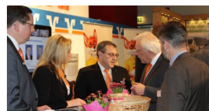
Gespräche am Stand der Raiffeisenbank Südstormarn Mölln eG.