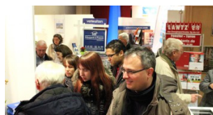
Gespräche und Besuche auf dem Immobilienfrüh- ling der Raiffeisenbank Südstormarn Möln eG.