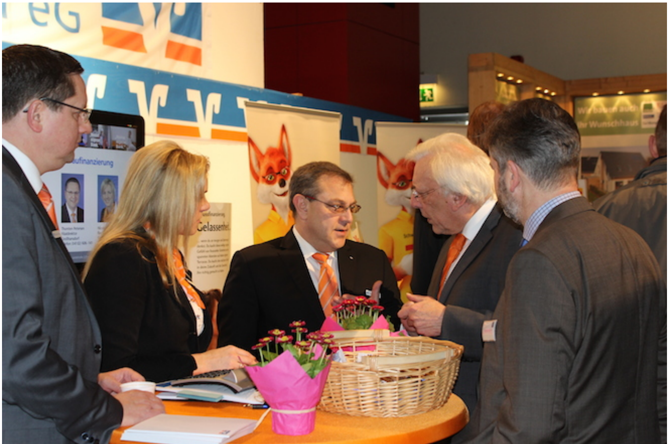
Gespräche am Stand der Raiffeisenbank Südstormarn Mölln eG.

Ahrensburg (ve). Der Immobilienmarkt in Stormarn hat Dynamik - und das war auch an der Messe Immobilienfrühling der Raiffeisenbank Südstormarn Mölln eG zu spüren. Viel Laufkundschaft fand sich den Tag über im Marstall auf der Messe ein, Aussteller waren nahezu permanent in Kunden-Gesprächen.