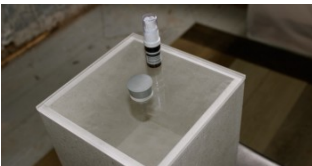
Ausstellung der Firma greendayhome in der Villa Pomona zum Thema gesundes Raumklima: