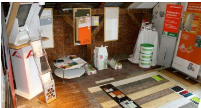
Ausstellung der Firma greendayhome in der Villa Pomona zum Thema gesundes Raumklima: Beispiele für gesunde Baumaterialien werden vorgestellt.