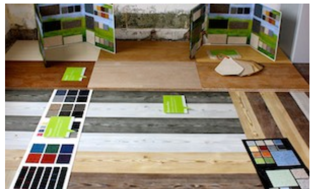
Ausstellung der Firma greendayhome in der Villa Pomona