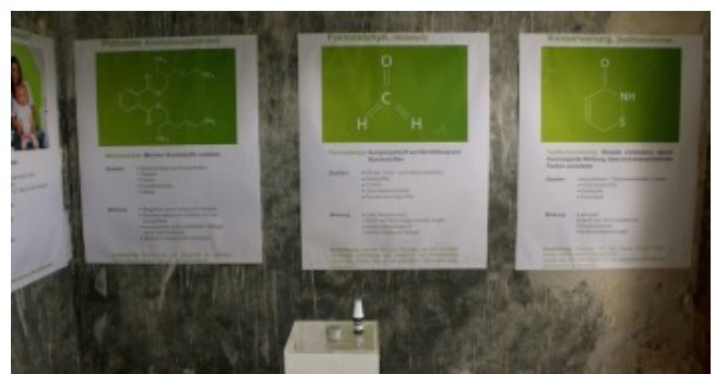
Ausstellung der Firma greendayhome in der Villa Pomona zum Thema gesundes Raumklima: Auf großen Tafeln werden Baustoffe beschrieben, von denen eine Gefahr ausgehen kann, sowie ihre potenzielle Wirkungsweise auf den menschlichen Körper.