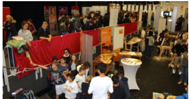
2. Berufsinformationsmesse im Schulzentrum am Heimgarten.