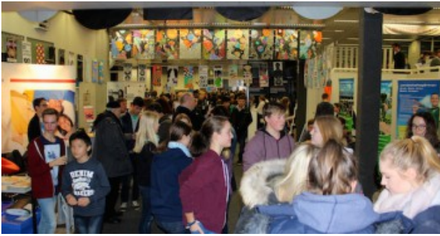
2. Berufsinformationsmesse im Schulzentrum am Heimgarten.