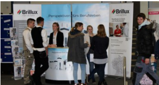
2. Berufsinformationsmesse im Schulzentrum am Heimgarten.