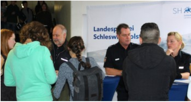
2. Berufsinformationsmesse im Schulzentrum am Heimgarten.