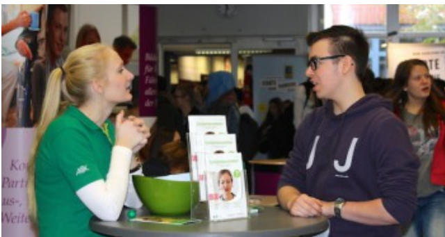
2. Berufsinformationsmesse im Schulzentrum am Heimgarten.