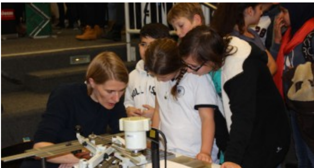
2. Berufsinformationsmesse im Schulzentrum am Heimgarten.