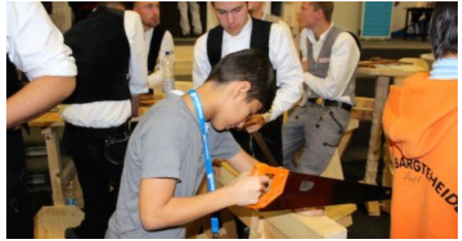
2. Berufsinformationsmesse im Schulzentrum am Heimgarten. Auf der Aktionsfläche der Kreishandwerkerschaft Stormarn.