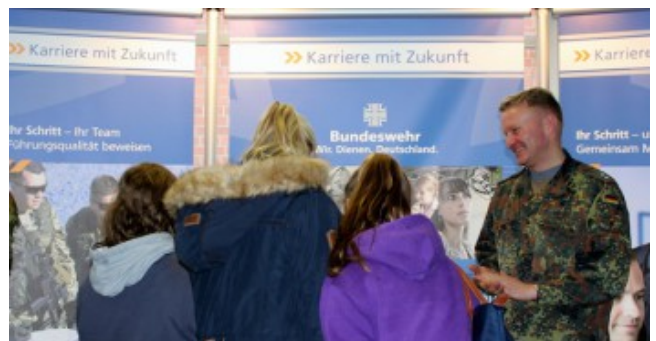
2. Berufsinformationsmesse im Schulzentrum am Heimgarten.