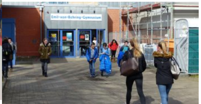
Festakt 50 Jahre Emil-von-Behring-Gymnasium.