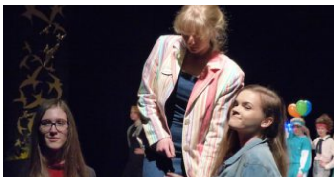
Festakt 50 Jahre Emil-von-Behring-Gymnasium. Mode aus 50 Jahren EvB, getragen von Schülerinnen des Jahrgangs Q1.