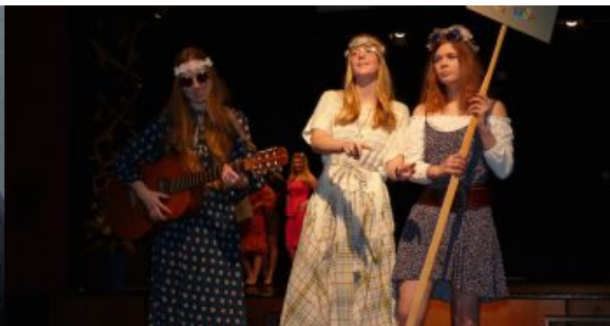
Festakt 50 Jahre Emil-von-Behring-Gymnasium. Mode aus 50 Jahren EvB, getragen von Schülerinnen des Jahrgangs Q1.