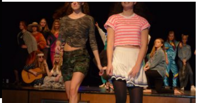
Festakt 50 Jahre Emil-von-Behring-Gymnasium. Mode aus 50 Jahren EvB, getragen von Schülerinnen des Jahrgangs Q1.