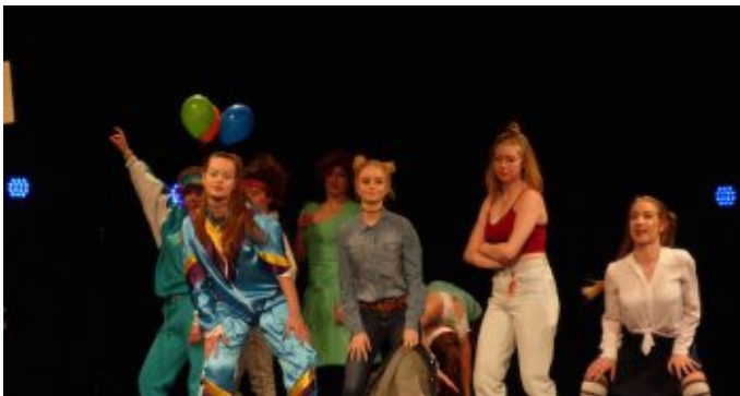
Festakt 50 Jahre Emil-von-Behring-Gymnasium. Mode aus 50 Jahren EvB, getragen von Schülerinnen des Jahrgangs Q1.