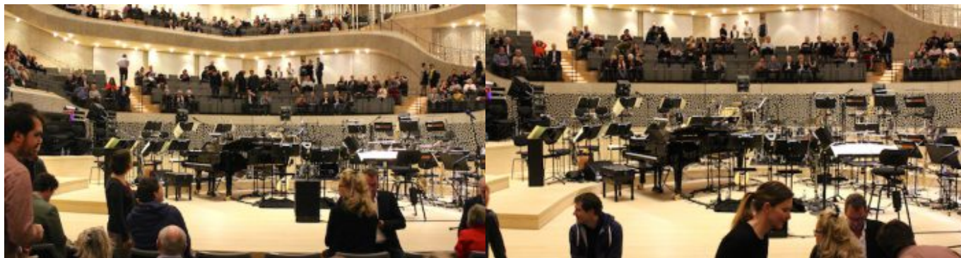
„Salem Syria“ - Konzertprojekt mit syrischen Musiker und der NDR Bigband in der Hamburger Elbphilharmonie.