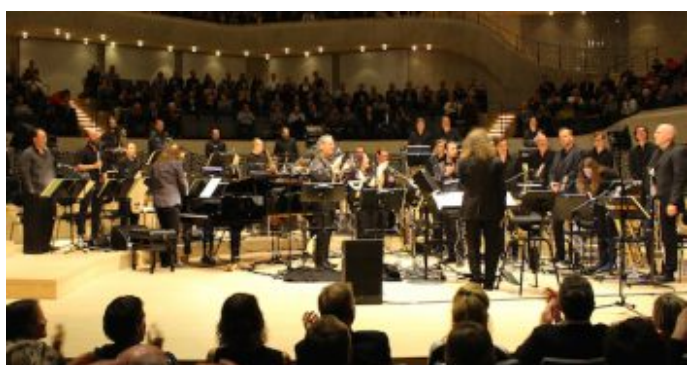
„Salem Syria“ - Konzertprojekt mit syrischen Musiker und der NDR Bigband in der Hamburger Elbphilharmonie.