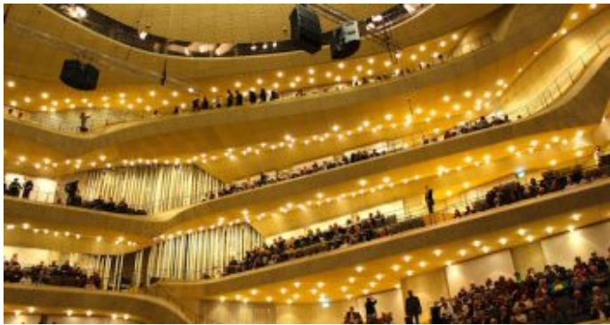
„Salem Syria“ - Konzertprojekt mit syrischen Musiker und der NDR Bigband in der Hamburger Elbphilharmonie.