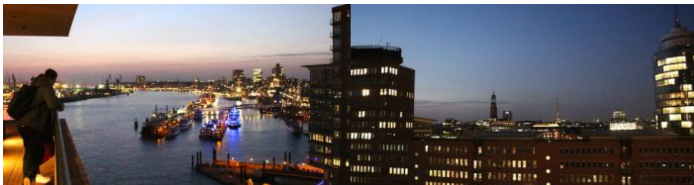
„Salem Syria“ - Konzertprojekt mit syrischen Musiker und der NDR Bigband in der Hamburger Elbphilharmonie. Blick von der Plaza in den Hafen.