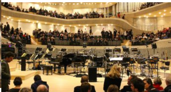
„Salem Syria“ - Konzertprojekt mit syrischen Musiker und der NDR Bigband in der Hamburger Elbphilharmonie.