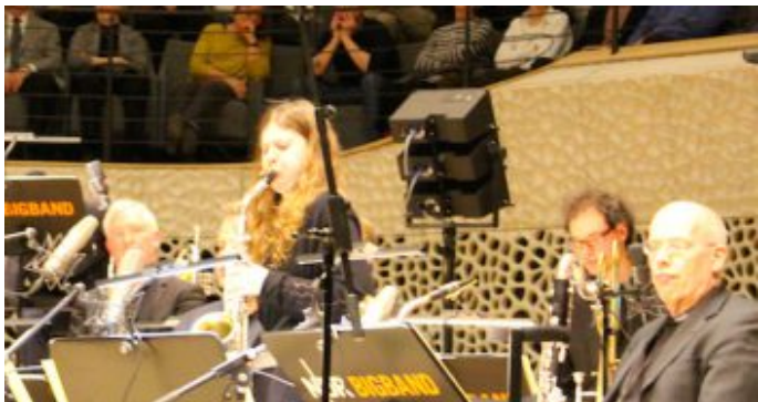
„Salem Syria“ - Konzertprojekt mit syrischen Musiker und der NDR Bigband in der Hamburger Elbphilharmonie.