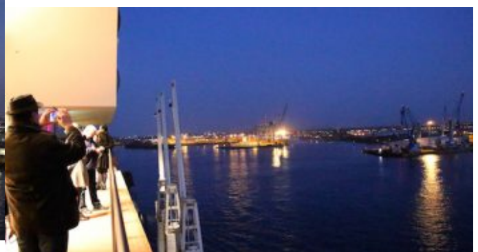
„Salem Syria“ – Konzertprojekt mit syrischen Musiker und der NDR Bigband in der Hamburger Elbphilharmonie. Blick von der Plaza in den Hafen.