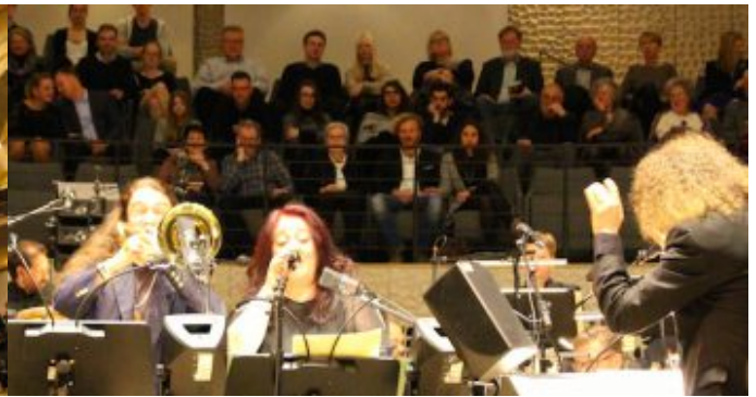
„Salem Syria“ - Konzertprojekt mit syrischen Musiker und der NDR Bigband in der Hamburger Elbphilharmonie.