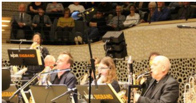
„Salem Syria“ - Konzertprojekt mit syrischen Musiker und der NDR Bigband in der Hamburger Elbphilharmonie.