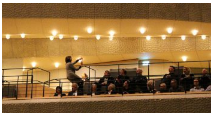
„Salem Syria“ - Konzertprojekt mit syrischen Musiker und der NDR Bigband in der Hamburger Elbphilharmonie.