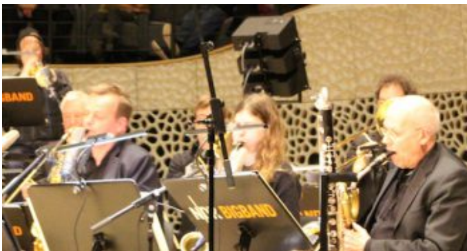
„Salem Syria“ - Konzertprojekt mit syrischen Musiker und der NDR Bigband in der Hamburger Elbphilharmonie.