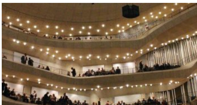
„Salem Syria“ - Konzertprojekt mit syrischen Musiker und der NDR Bigband in der Hamburger Elbphilharmonie.