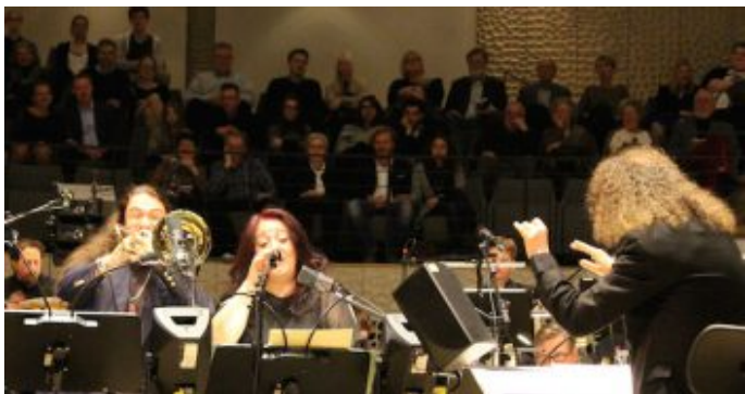
„Salem Syria“ - Konzertprojekt mit syrischen Musiker und der NDR Bigband in der Hamburger Elbphilharmonie.