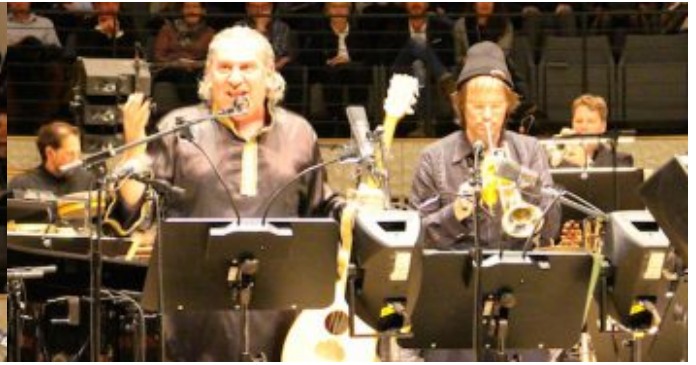
„Salem Syria“ - Konzertprojekt mit syrischen Musiker und der NDR Bigband in der Hamburger Elbphilharmonie.