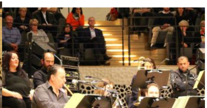
„Salem Syria“ - Konzertprojekt mit syrischen Musiker und der NDR Bigband in der Hamburger Elbphilharmonie.