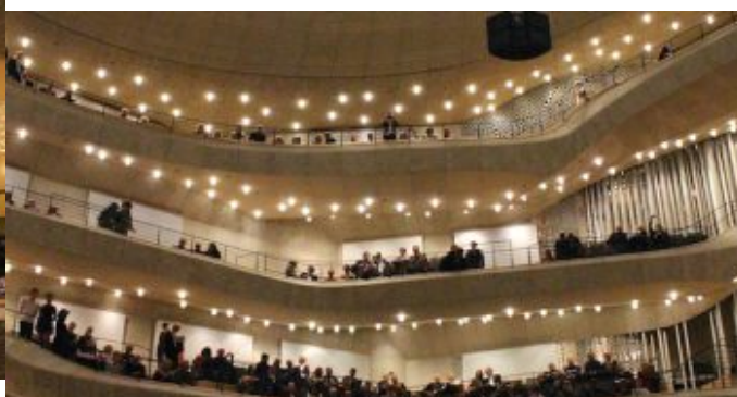
„Salem Syria“ - Konzertprojekt mit syrischen Musiker und der NDR Bigband in der Hamburger Elbphilharmonie.